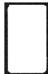
5. völlig beschichtete Oberfläche