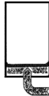
2. Ballastwasser pumpen